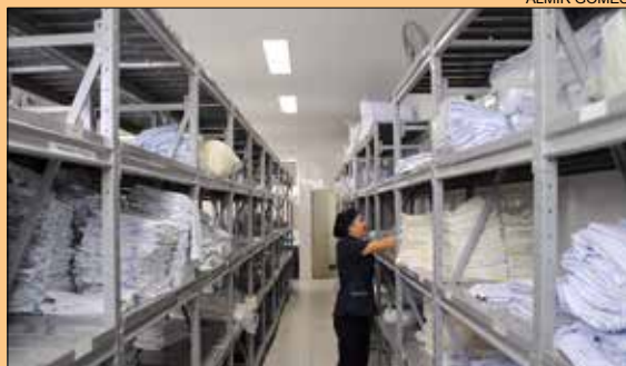
ROUPARIA DE CASA NOVA • página 4