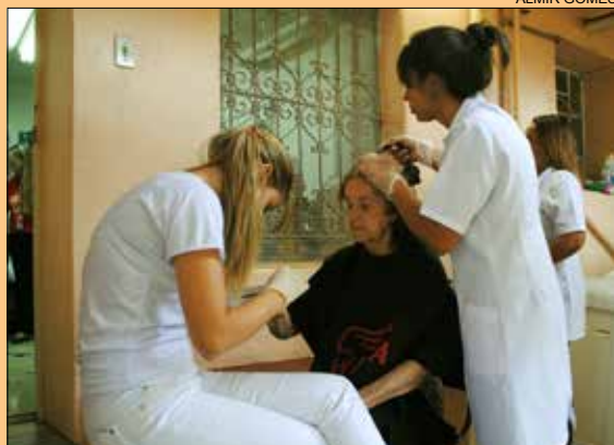
DIA DA BELEZA NO IGAP • página 5