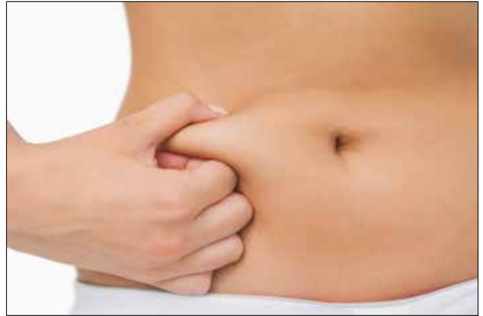
A retenção de líquidos é o acúmulo anormal de água entre as células do organismo que pode ser causada por excesso de consumo de sal, doença renal ou insuficiência cardíaca

Evitar o excesso de sal na alimentação, o consumo de alimentos industrializados (ricos em sódio) e praticar atividades físicas são fatores que ajudam a minimizar a retenção hídrica. No entanto, se o aumento de peso for consequência do ganho de massa gorda, a indicação é fazer uma avaliação nutricional para reeducação alimentar e praticar atividades físicas regulares pelo menos 3 vezes por semana.