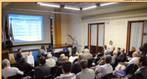
ASSEMBLEIA GERAL • página 3