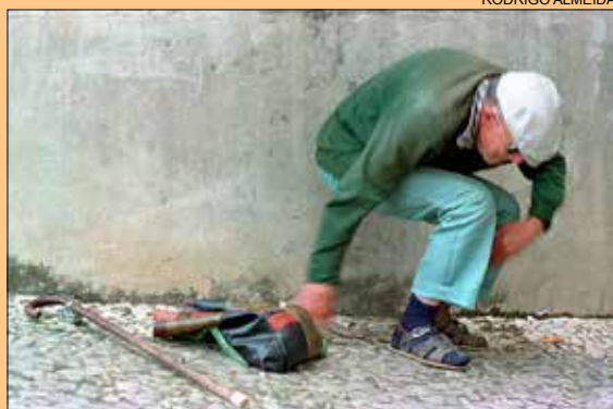
O ABC DA OSTEOPOROSE • página 4