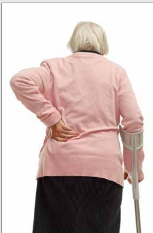
A osteoporose é preocupante porque atinge majoritariamente as pessoas idosas. Em 2050, 37% dos brasileiros terão mais de 50 anos.

domésticos sem obstáculos, bem iluminados e com pisos não escorregadios para evitar quedas e colisões. Herança genética, alimentação deficiente em vitamina D e deficiência na produção de hormônios também são causas que podem levar à osteoporose, cuja incidência é maior também em pessoas de pele branca, baixas e magras.