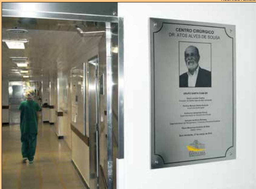
ELE MERECE... • página 5